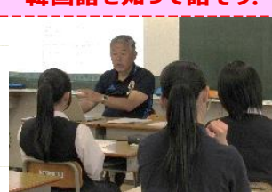
韓国語を知って話そう!