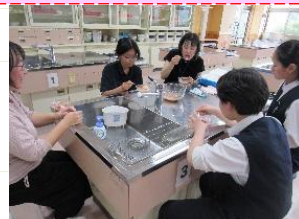
調理クラブ ~パン作り~