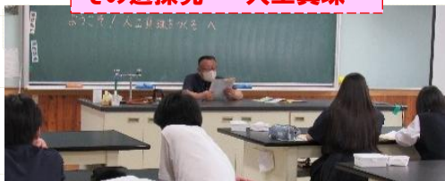
その道探究 ~人工真珠~