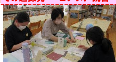
その道探究 ~ビブリオ・読書~