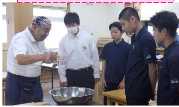
調理クラブ ~そば作り~