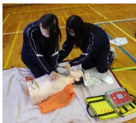
心肺蘇生法・AED講座

午後は防災講座を行い、5講座を開設しました。生徒たちは希望をもとに縦割りのグループに分かれ、それぞれの講座に参加して、様々なことを教えていただいたり、体験を通して学んだり充実した時間になりました。素敵な姿をたくさん見るすることができました。ご協力ありがとうございました。