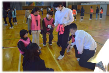
小6と1年との合同授業の様子

1年生は青木小の6年生と一緒にポッチャをしたり、6年生の前でチェリーを歌ったり、中学校の生活について発表したりしました。6年生も一生懸命話を聞いたり、楽しそうにポッチャをやったりしていました。6年生に話をする1年生はとても大きく成長したと感じました。もうすぐ先輩になります。