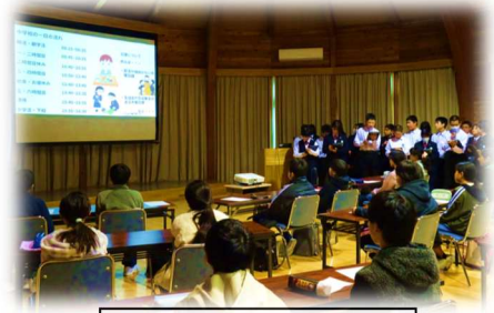
小6への中学校説明会