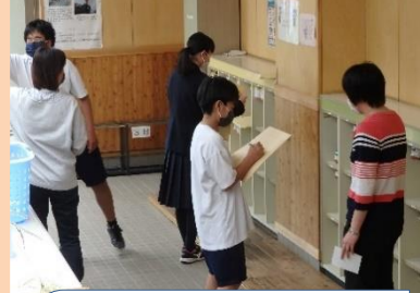
課題の回収と配布