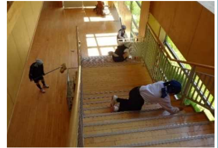
本校の実現したい5つの姿の一つ 「心を磨く清掃」に取り組みます。